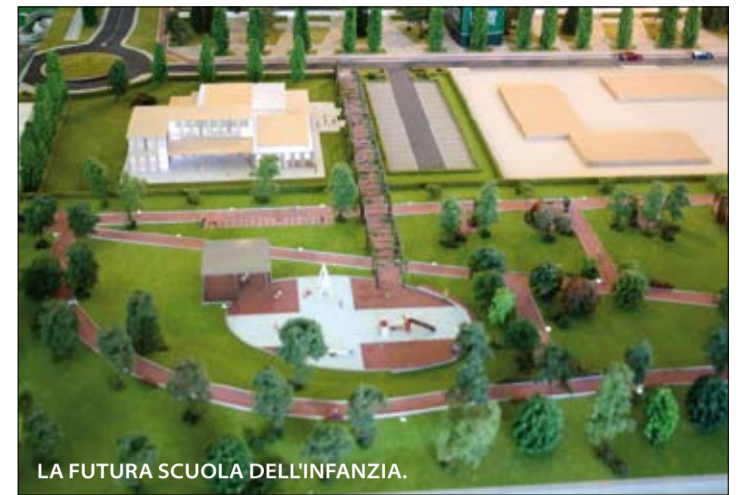
LA FUTURA SCUOLA DELL'INFANZIA.