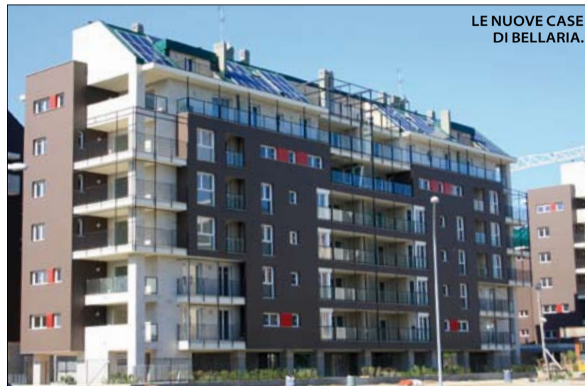
LE NUOVE CASE DI BELLARIA.

Un comportamento indegno di un vero sindaco e immorale nei confronti dei cittadini , calpestati nelle loro speranze e nei loro diritti. □