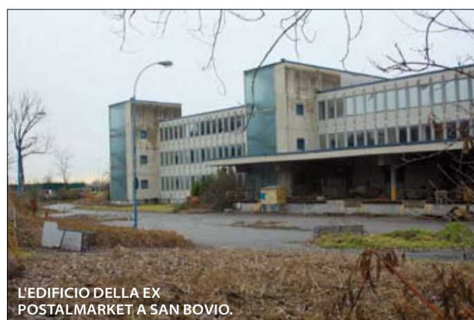
L'EDIFICIO DELLA EX POSTALMARKET A SAN BOVIO.