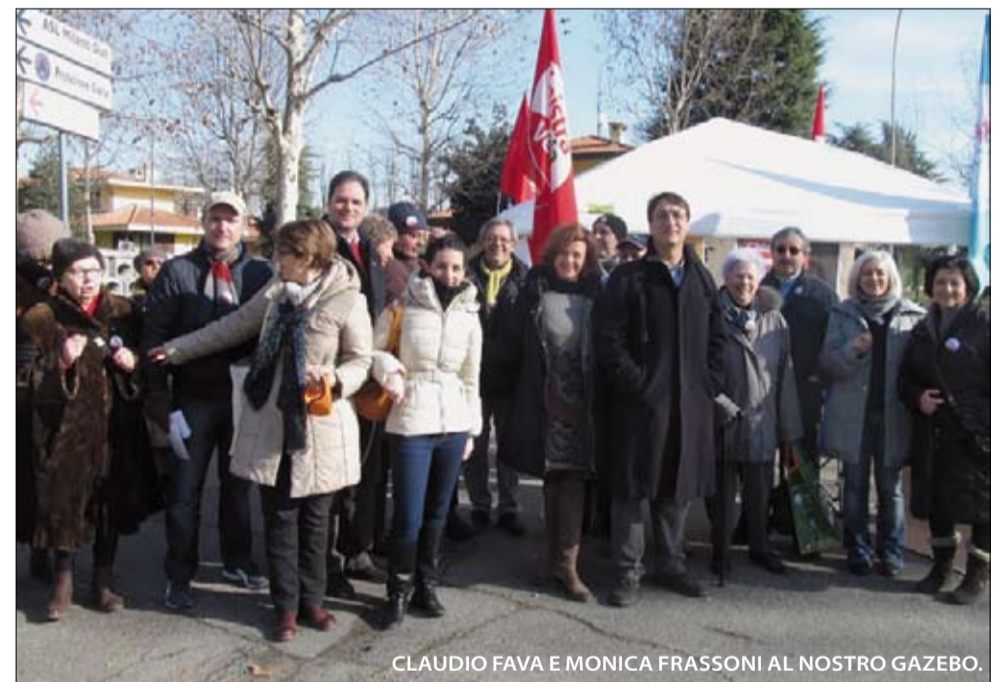
CLAUDIO FAVA E MONICA FRASSONI AL NOSTRO GAZEBO.

Il voto, ogni singolo voto, è l'arma pacifica della nostra democrazia. Per quanto si tenti sempre più di snaturarlo come merce che si vende e si compra, il voto non ha altro prezzo che non sia la dignità di chi lo esercita in maniera libera e responsabile. Solo così diventa l'arma di cui ogni singolo cittadino pacificamente dispone per scardinare l'andamento delle cose, aprendo le porte al cambiamento. È il cambiamento il nostro orizzonte, con il voto e dopo il voto. Perché è il cambiamento ad essere, qui ed ora, la partita veramente "utile", necessaria, che ci mette in gioco. Nichi Vendola